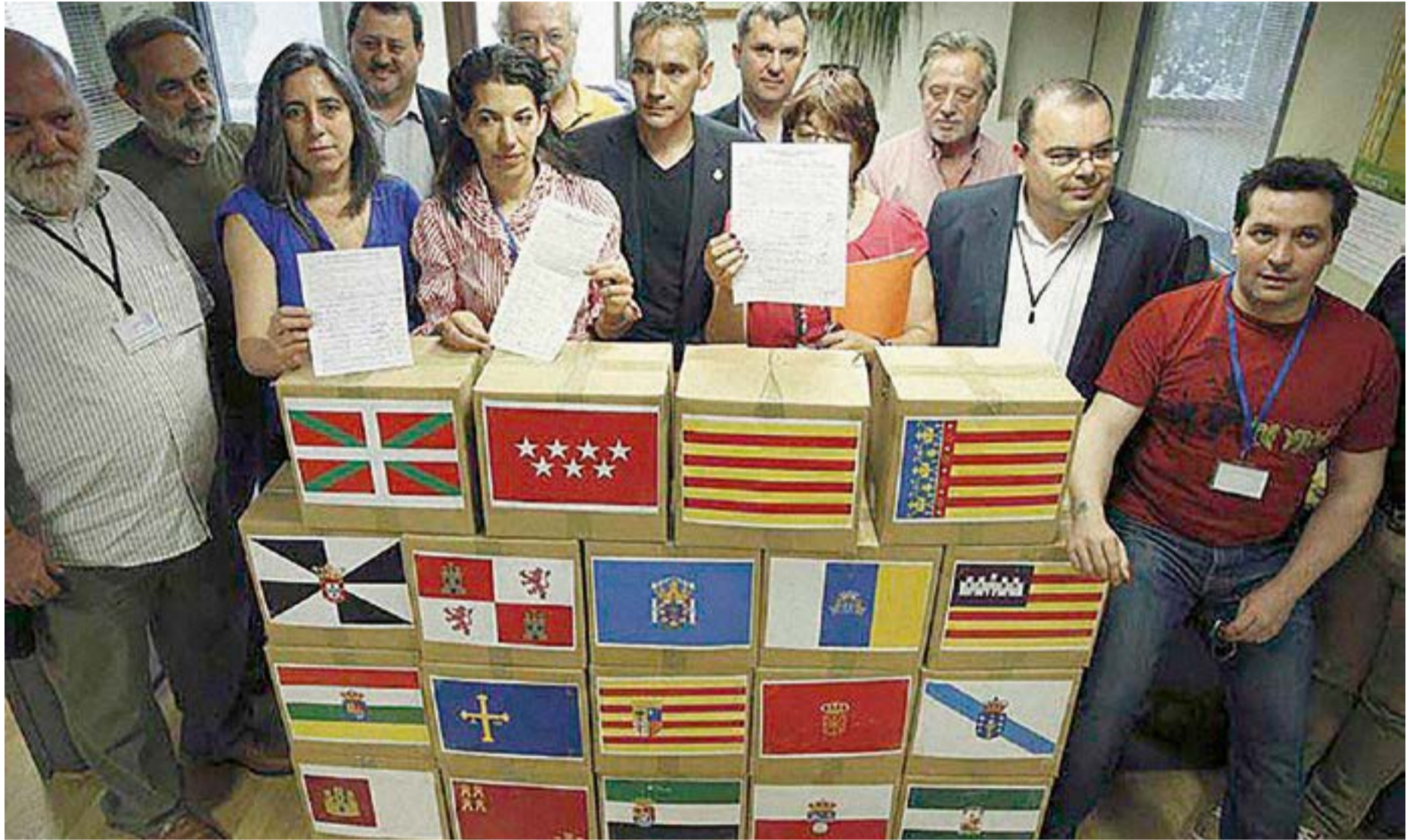
Primera de las cuatro entregas, realizadas ante la Defensoría del Pueblo, de firmas recogidas en las diecisiete comunidades autónomas.

* La MERP hemos elegido la RECOGIDA DE FIRMAS como campaña porque nuestro objetivo es impulsar un amplio movimiento QUE UNA A TODO EL PAÍS, por encima de cualquier diferencia, y hemos elegido entregarlas a las DEFENSORÍAS DEL PUEBLO porque es quien según la Ley debe amparar a la ciudadanía ante leyes injustas o cuya aplicación provoque injusticias.