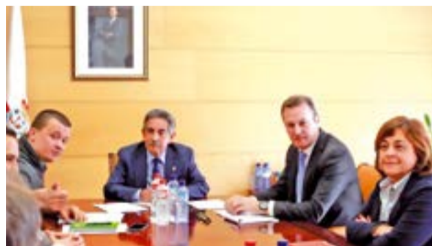
Miembros de la portavocía de la MERP con el presidente de Cantabria Miguel Ángel Revilla recibiendo su apoyo

En febrero de 2017, el Parlamento de Navarra aprobó una declaración institucional apoyando la propuesta para Blindar las Pensiones en la Constitución de la MERP