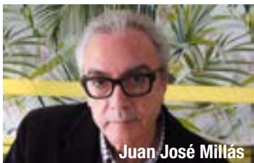
Juan José Millás