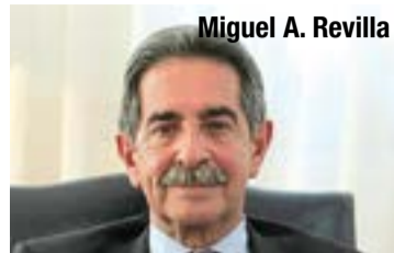
Miguel A. Revilla